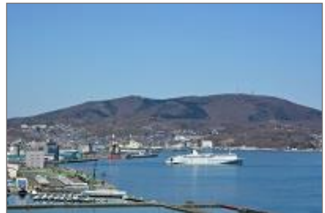
小樽港(新日本海フェリー)

今は府中に住んでいますが、毎年、小樽に帰省 きせい し、子供時代 こどもじだい を思い出しています。