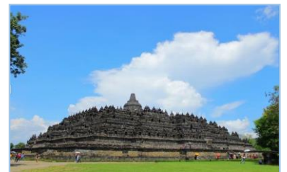
ボロブドウル寺院

ボロブドウル寺院、セログリヨ寺院、そしてカイランゲン公園、アルンアルン公園、その他多くの美しい自然があり、この街の観光名所も興味深いものです。